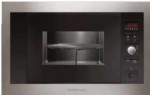
Four à micro-ondes