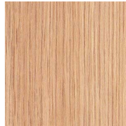
Effet bois (chêne)