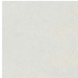
Gris clair (texturisé)