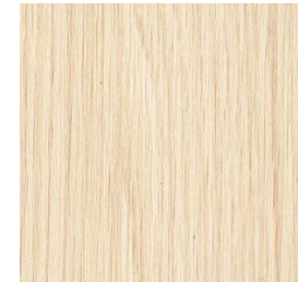
Effet bois (clair)